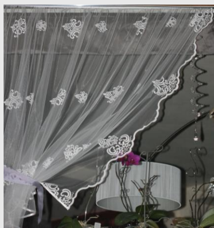
Im większą powierzchnię okna zasłaniają firany czy rolety tym lepiej.

Możesz skutecznie zapobiegać kolizjom ptaków z szybami Twoich okien.