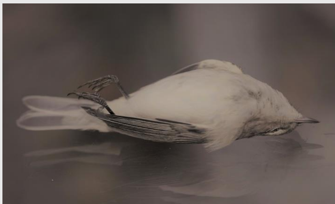
Pierwiosnek ( Phylloscopus collybita )- ofiara kolizji z szybą okienną. Najczęstszą przyczyną śmierci ptaków w wyniku kolizji z szybą są krwotoki śródczaszkowe.