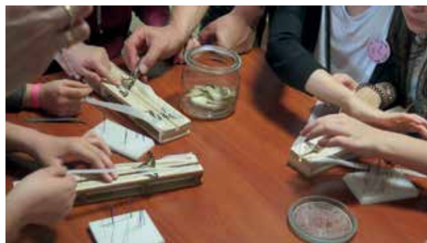
Ryc. 6. Preparowanie motyli – nie taki diabeł straszny.

a w ślad za nią i wiedza, których uproszczonym obrazem są podręczniki szkolne, filmy przyrodnicze prezentowane w programach telewizyjnych i w Internecie; po co się to wszystko robi? jakie to ma praktyczne znaczenie dla gospodarki narodowej? Można przypuszczać, że z grona dzieci i młodzieży