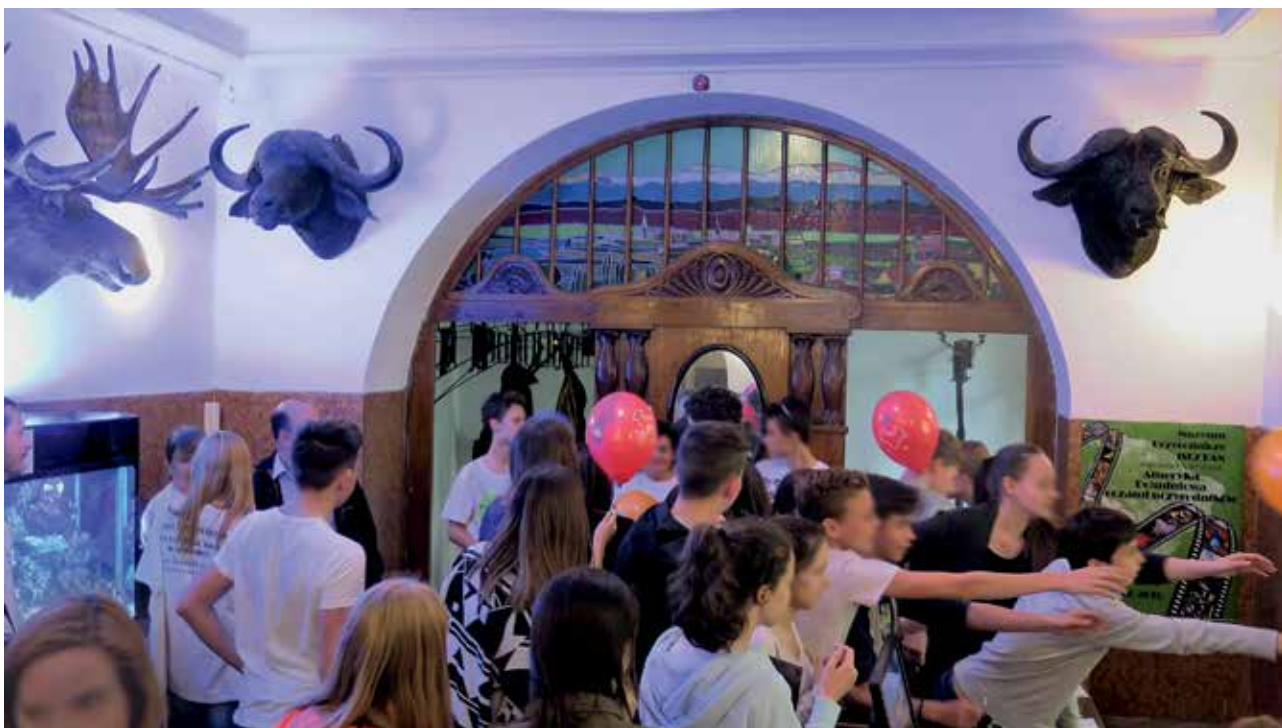
Ryc. 9. Odbiór materiałów i pamiątek przed wyjściem z Muzeum.

Edycje festiwalowe przyszłości mogłyby odbywać się w miejscach nie wykorzystywanych dotychczas,