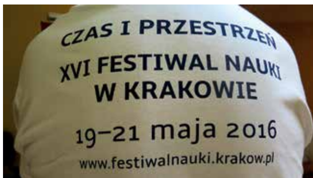
Ryc. 1. Koszulka z hasłem festiwalowym.

Krótką acz bogatą w wydarzenia historia dnia, o którym mowa niżej, włączonego w ciąg wydarzeń Festiwalu Nauki w Krakowie wydłużyła się o kolejny, czwarty rok. Sam Festiwal zaistniał po raz pierwszy w Krakowie, mieście festiwalu, w 2000 r., aby popularyzować naukę oraz osiągnięcia krakowskich uczelni wyższych i instytutów badawczych PAN. Tym samym dołączył do ponad 100 festiwali odbywających się w Krakowie, z których około połowa ma znaczenie międzynarodowe. Nie podejmuję się oceny rangi całego Festiwalu Nauki. Dzień, o którym mowa, ma znaczenie ściśle lokalne, wychodząc naprzeciw potrzebom poznawczym i edukacyjnym dzieci i młodzieży. Wydarzenie to jest mi znane jako wolontariuszowi-ochotnikowi.