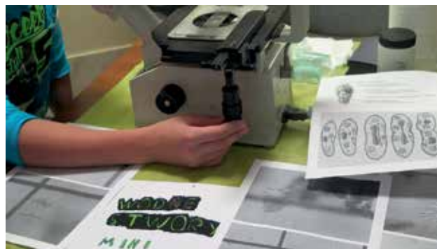
Ryc. 5. Wodne stwory i potwory – czyli mikrozoo.

Zajęcia festiwalowe nie były więc tylko zwiedzaniem Muzeum, ale przede wszystkim warsztatami, zajęciami laboratoryjnymi, na które brakuje czasu i możliwości w szkołach. Uczestnicy zajęć dowiedzieli się, jakimi metodami i jakim sprzętem posługują się przyrodnicy prowadzący badania w terenie i później, w zaciszu pracowni; jak powstaje nauka,