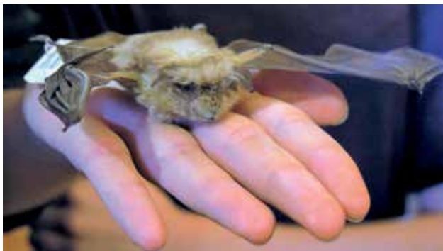
Ryc. 7. Jak badać niewidzialne? – tajemniczy świat nietoperzy.

przede wszystkim możliwość ukazania laikowi rzeczywistości niedostępnej na co dzień. W tym roku postawiono na komfort uczestników w ukierunkowanym poznawaniu przyrody, a więc mniej osób, ale nieprzypadkowych.