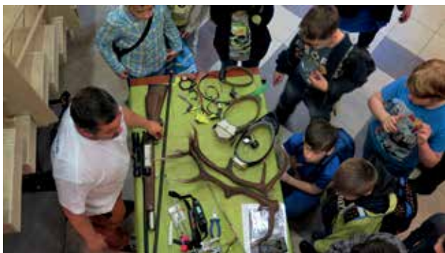
Ryc. 3. Duże zwierzęta.

Jeżeli nawet nie umieją teraz uświadomić sobie tego dokładnie, to mają przygotowanie i punkt wyjścia do dalszego rozwoju intelektualnego na kolejnych etapach edukacji. Pomieszczenia muzealne dały możliwość nowych rozwiązań organizacyjnych i kontaktu z okazami tak utrwalonymi jak i żywymi wchodzącymi w skład ekspozycji muzealnej. Nowoczesne muzeum przyrodnicze to nie tylko okazy zakonserwowane, ale i żywe organizmy w akwariach i wiwariach.