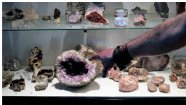
Ryc. 8. Co leży przy drodze? – O zbieraniu minerałów i skamieniałości.

Nauki nie powinien raczej wycofać się w inne bardziej spokojne miejsca, gdzie byłby wydarzeniem samym dla siebie, dla swojego oddziaływania na zainteresowanych, dla swojego wyjątkowego charakteru? Sąsiedztwo wszystkich innych sytuacji, wydarzeń nie